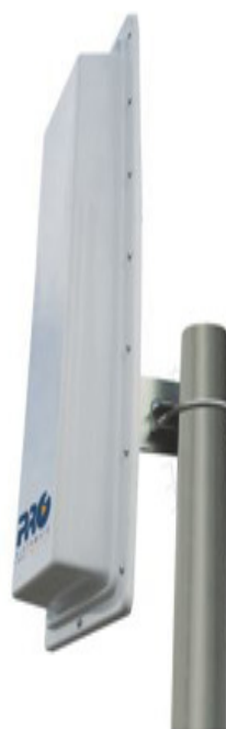
Antena Paniel Setorial 90° 2.4 PQS9-2412